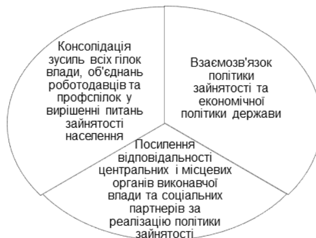
Рис. 1. Ключові позиції державного регулювання зайнятості населення

Отже, державне регулювання зайнятості - це «комплекс заходів державного впливу на ринок праці з метою забезпечення продуктивної зайнятості та соціального захисту населення. Вагомість цієї мети визначається як економічними, так і соціальними наслідками безробіття (для суспільства в цілому і для кожної особи)» [13, с.132]. Суспільство зацікавлене в тому, щоб всі його працездатні громадяни працювали, оскільки за інших рівних умов забезпечує зростання валового внутрішнього продукту країни. Крім того, основні завдання соціально-економічного розвитку країни вимагають створення умов зростання рівня трудової активності населення. Пріоритети державної політики в сфері зайнятості визначаються з урахуванням проблем економічного національного розвитку відповідно до законодавчо-нормативних забезпечень і фактичним станом ринку праці. Ключові позиції державного регулювання зайнятості населення наведено на рис.1.