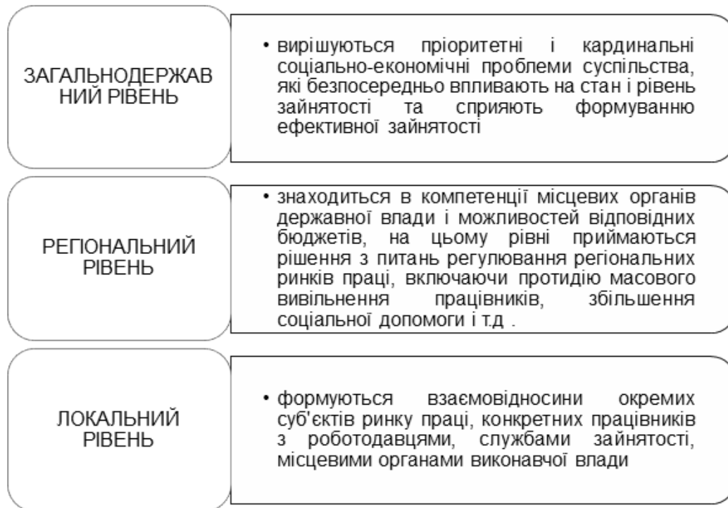
Рис. 2. Рівні регулювання ринку праці, зайнятості та безробіття