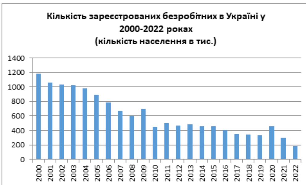
Рис. 5. Динаміка рівня безробіття в Україні у 2000-2022 р.р.

ність втрати роботи залежно від низки соціально-демографічних характеристик респондентів: віку, регіону та місця проживання, рівня освіти тощо.