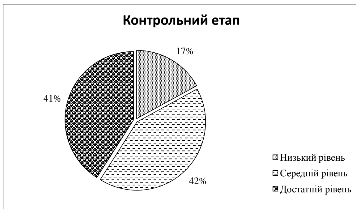
Рис. 2.2. Стан екологічної вихованості серед дітей старшого дошкільного віку на контрольному етапі дослідження

Під час проведення контрольного етапу педагогічного експерименту нами було проведено підсумкове опитування дітей старшого дошкільного віку з метою дослідження динаміки змін стану екологічної вихованості після проведеної серії заходів, що базувалась на визначених організаційно-педагогічних умовах., (рис.2.2.)