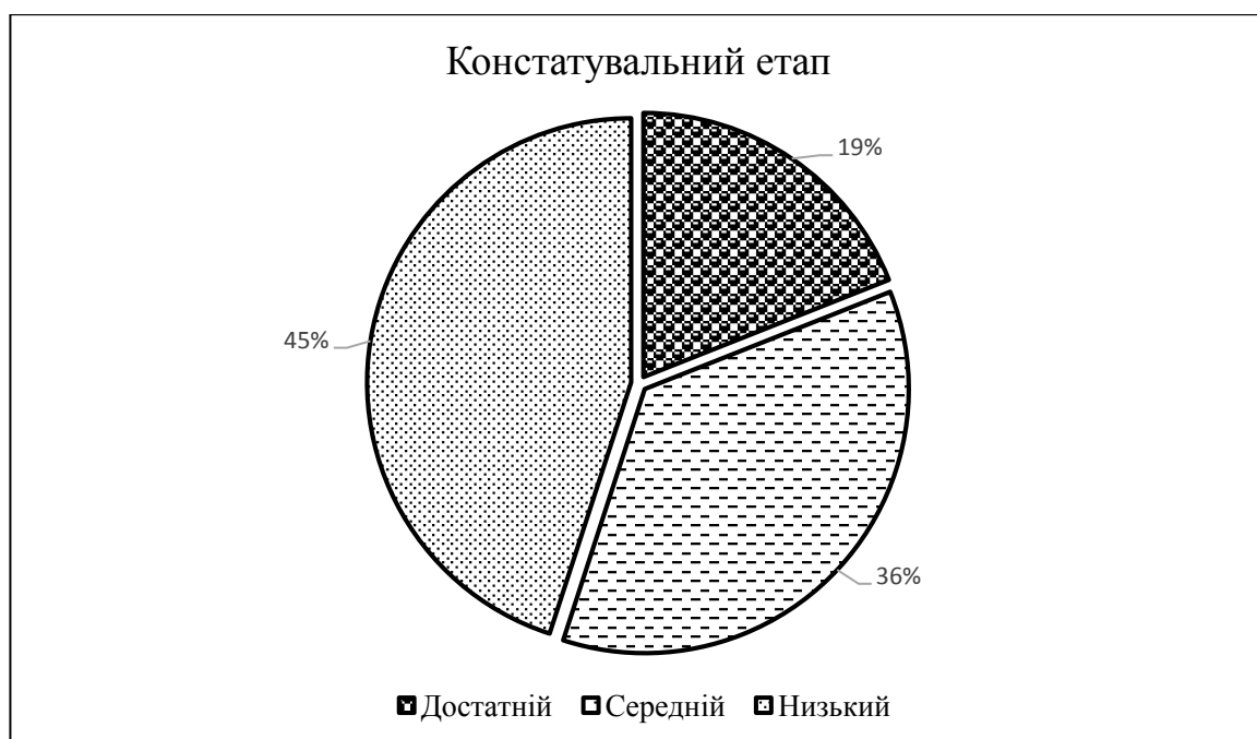
Рис. 2.1. Рівні екологічної вихованості дітей старшого дошкільного віку на констатувальному етапі дослідження

За усіма зазначеними критеріями можемо спостерігати наступні дані (рис.2.1).