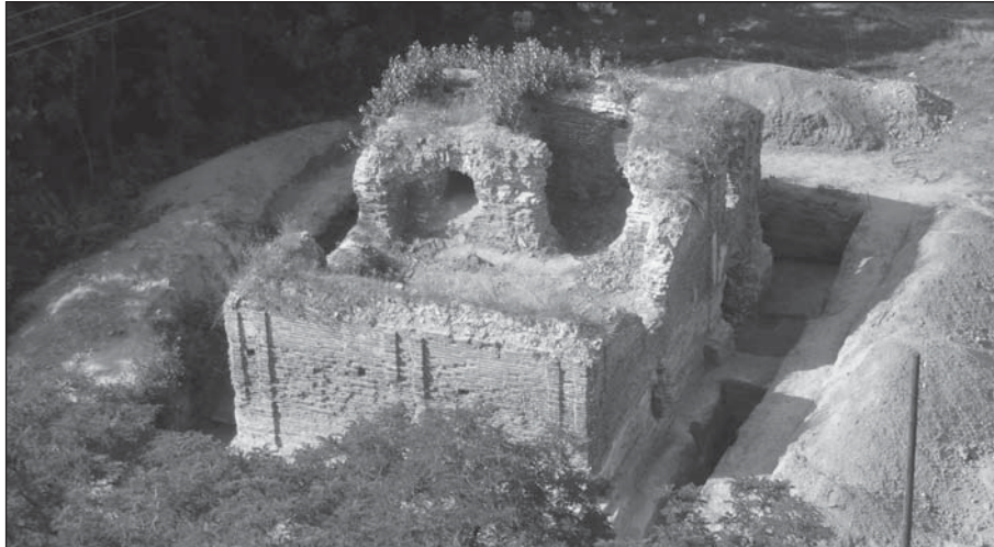
Рис. 1. Любеч, кам'яниця П. Полуботка. Вигляд з південного сходу