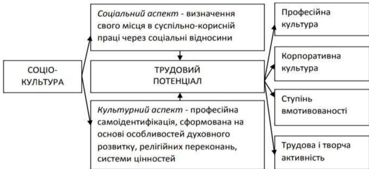
Рис. 1.1. Роль соціокультурного аспекту у формуванні та розвитку трудового потенціалу підприємств СКС