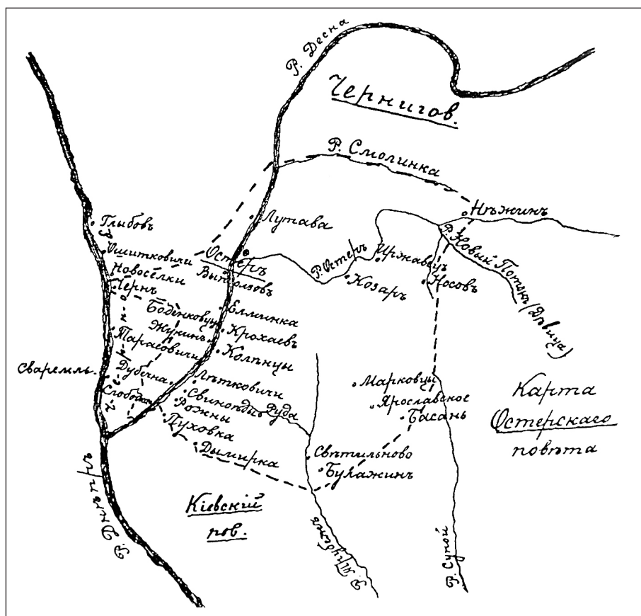
Рис. 1. Реконструкція кордонів Остерської волости (за: Клепатский, 2007, с. 239)

З ліквідацією у 1471 р. Київського князівства та утворенням воеводства, утворюються повіти – київський, мозирський, любецький, чернігівський, острозький, житомирський, острозький, канівський, черкаський та путивльський (Кондратьев, 2014, с. 38). Службу в цих замках несуть різноманітні категорії військовослужбової людності. Слуга ніс службу з ділянки землі, яка мала прогодувати його та його родину. Інколи землі називалися по роду служби – «земля ординська» чи «земля ковальська». Одна людина могла нести дві служби (дивлячись якими землями володів) – міг бути пушкарем та слугою кінним, чи ординцем та ковалем водночас. Своєрідною згадкою про монгольське панування були люди ясачні, які несли службу на замок (Клепатский, 2007, с. 417, 420). Так звана «ординська» служба кінця XVI ст. мала виразний регіональний прикордонний колорит. На Поділлі це був виїзд «подільської шляхти на Поле», у Чернібилі – «лежати (при воеводі) в Києві в час непокойный», в Острі – «ездити шляхов отведивати по той же стороне (Дніпра) Сиверской» та ін. До так званого «ординського» супроводу попервах були залучені усі слуги Київської землі, згодом поїздки до Орди стають повинністю виключно кінних слуг Овруччини та частини Заушшя (Яковенко, 2008, с. 248–250). Ще одна традиція у Великому князівстві Литовському, що була пов'язана із монгольською епохою – це традиція данництва. Давні традиції данництва проіснували аж до Люблінської унії 1569 р. (Грушевський, 1994, с. 220).