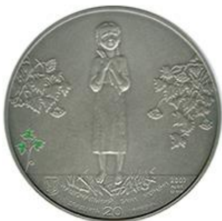
Ювілейна монета на честь 75-ї річниці Голодомору

Слово вчителя: на думку дослідниці Нані Гогохії, «дитина є ключем або кодом до розуміння всієї радянської цивілізації, бо політика в галузі