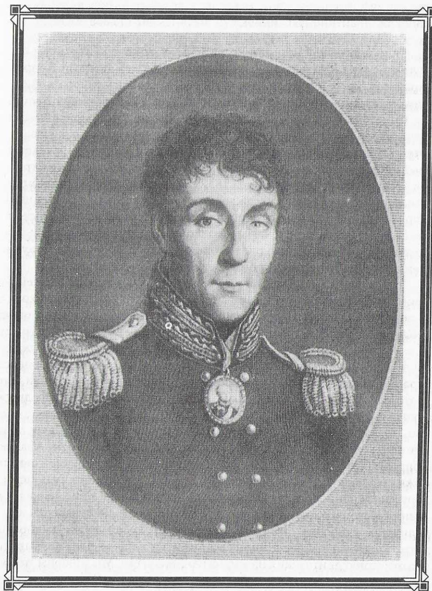
Алексей Андреевич АРАКЧЕЕВ

Книга написана профессиональными историками на базе богатейшего документального материала. Авторы стремились, отбросив предубеждения и идеологические клише, создать эскизные портреты жизни и судьбы русских консерваторов, людей, стремившихся сохранить столь дорогую их сердцу страну от надвигающейся катастрофы. Задача книги «Российские консерваторы» не идеологическая, а просветительская и авторы порой по-разному воспринимают многие вещи, придерживаются несхожих взглядов, что всё ещё так редко встречается в современных коллективных работах. В этой полифоничности, противоречивости оценок и умозаключений отпечаток нашего времени — неопределенного и переходного — отражение эпохи и людей её.