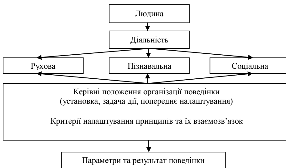
Рис. 1. Блок-схема організації поведінки людини в суспільстві

В житті людини чітко проглядаються рухова, пізнавальна та соціальна діяльність, які обумовлюють вектори та характер процесуальних функцій в роботі вчителя фізичної культури (рис. 1), а різноманіття професійних функцій вчителя, особливо вчителя фізичної культури, дозволяє розглядати педагогічну діяльність як складну єдність різних видів діяльності, взаємопов'язаних та взаємозв'язаних, які забезпечують ефективність освітнього процесу.