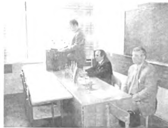
Відкриття III Міжнародного семінару "Проблеми всесвітньої історії: держави та суспільство в історичній ретроспективі" (2006 р.)

Викладачі кафедри регулярно беруть участь у міжнародних, всеукраїнських і регіональних наукових конференціях. Традиційним стало проведення на базі кафедри Міжнародного семінару "Проблеми всесвітньої історії: держава та суспільство в історичній ретроспективі", в якому беруть участь науковці України, Росії та Білорусі.