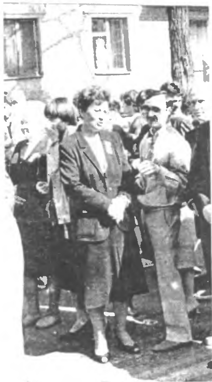
Викладачі кафедри загальної історії на першотравневій демонстрації (1987 р.)