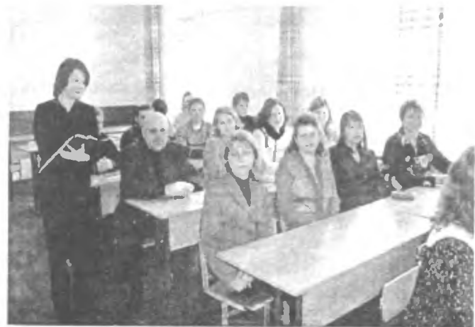
Засідання науково-методичного семінару кафедри всесвітньої історії (2006 р.)

Постійно проводяться засідання науково-методичного семінару кафедри, на яких розглядаються актуальні питання навчально-методичної, наукової та виховної роботи. Під керівництвом професора К.М. Ячменіхіна на кафедрі працює спецсемінар, учасники якого – студенти старших курсів, магістратури, аспіранти та молоді викладачі кафедри, вивчають питання соціально-економічної та політичної історії Росії XIX-XX ст.