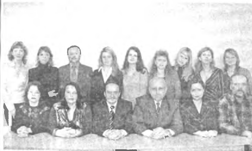
Кафедра всесвітньої історії

До бібліографії наукових праць включено публікації, оприлюднені під час роботи викладачів та співробітників на кафедрі всесвітньої історії.