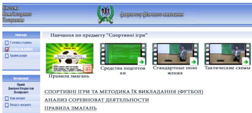
Рис 1.3. Навчання

Проходження тестування. Основа СКНІТ побудована на проходженні тестів, які використовуються як дня навчання так і для контролю (рис. 1.4).