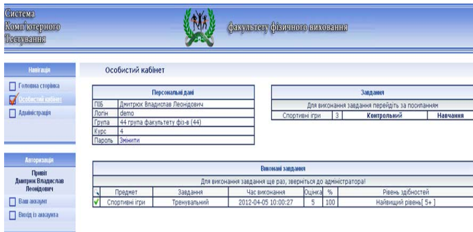
Рис 1.2. Особистий Кабінет

Виконані завдання – тут ми бачимо уже виконані завдання, предмет по якому ми проходили оцінювання, вид завдання (в даному випадку контрольний), дату та час виконання, оцінку, кількість відсотків правильних відповідей, та повідомлення про рівень здібностей. При натиску курсором на зелену галочку біля тесту користувач може переглянути на яке питання він дав правильну чи помилкову відповідь.