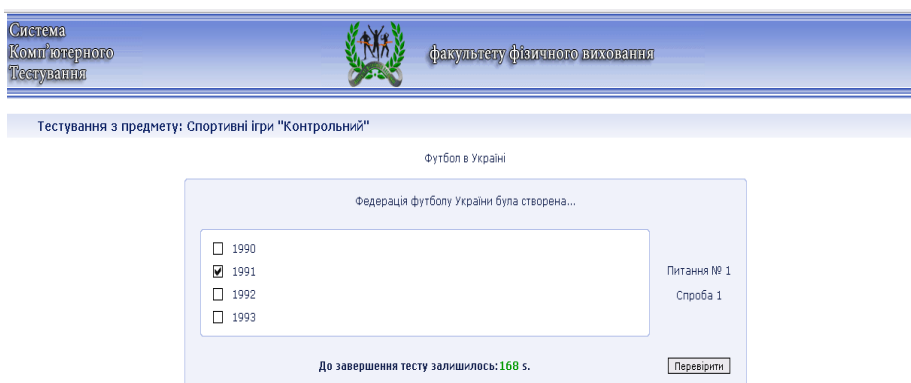
Рис 1.4. Проходження тестування

Проходження тестування. Основа СКНІТ побудована на проходженні тестів, які використовуються як дня навчання так і для контролю (рис. 1.4).