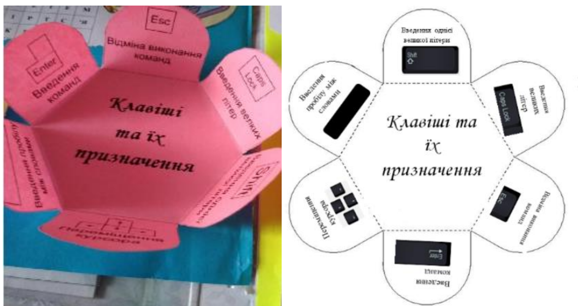
Рис. 2. Вигляд мінікниги із завданням та його шаблон

Завдання «Клавіші та їх призначення» ми подали вигляді квітки-розгортки (див. Рис. 2) . На пелюстках зображено клавіші та їх призначення.