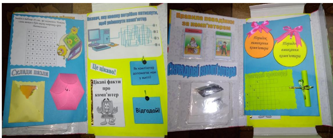
Рис. 1. Фото лепбуку "Я і цифрові пристрої"

Авторами статті розроблено технологію створення лепбуку «Я і цифрові пристрої» (див. Рис.1) інтегрованого курсу «Я досліджую світ»