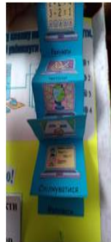
Рис. 4. Мінікнига та схема-узагальнення до завдання «Як комп'ютер допомагає нам у житті»