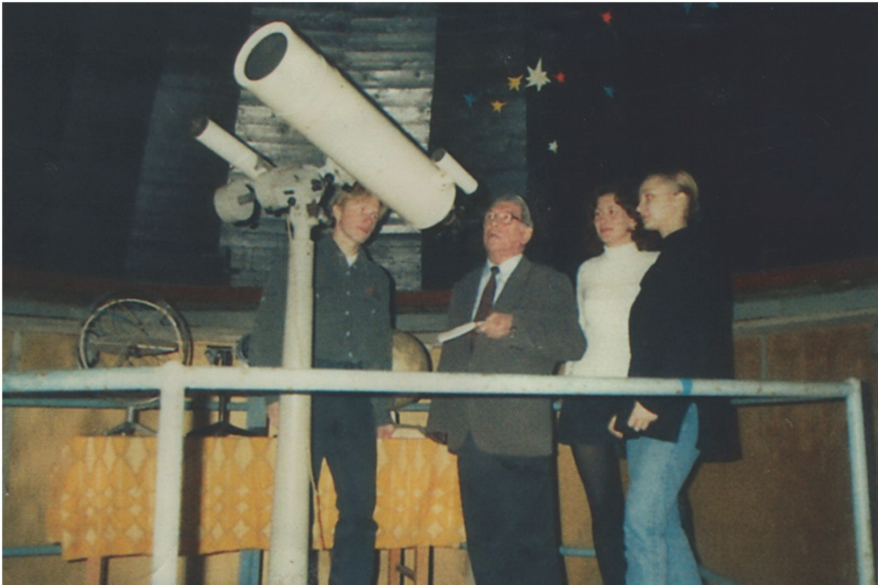
Заняття у астрономічній обсерваторії