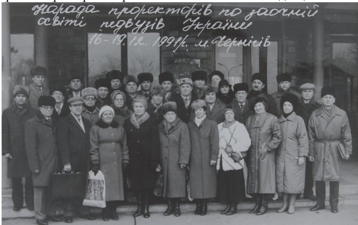
Проректори заочних відділень педвишів радилися у Чернівці

Аналіз проведених міністерських контрольних робіт з фундаментальних та спеціальних дисциплін дав привід для ректорату, деканатів, кафедр провести об'єктивний, вимогливий самоаналіз з метою удосконалення фундаментальної і спеціальної підготовки майбутніх педагогів. Після даної перевірки для всіх деканатів стало правилом щосеместра проведення контрольних ректорських робіт з основних навчальних дисциплін.