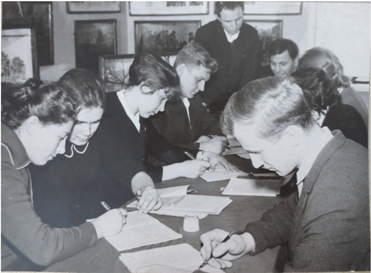
Консультування студентів до перших пробних уроків

цій. Разом з тим потрібно було підлаштуватись також і під шкільний розклад [243, арк. 116].