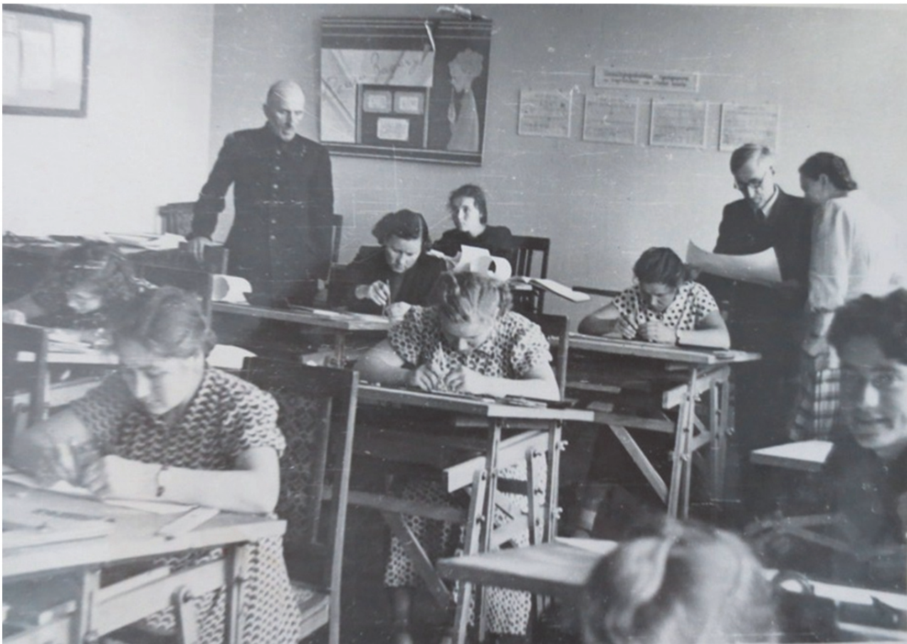
У кабінеті креслення

Загальна площа навчальних приміщень у 1974 р. становила 6032 м 2 , а на 1 студента – 3,29 м 2 . З 25 аудиторій, в яких навчались студенти, лише 5 – були груповими, розрахованими на 25 осіб, 7 – на 50 осіб, 8 – на 75 осіб, 3 – на 100 осіб і 2 вміщали більше 100 студентів. Окрім того, працювали 23 кабінети та 22 лабораторії, 5 майстерень, 2 читальні та 2 спортивні зали. Технічними засобами на постійній основі були оснащені 6 кабінетів та 8 лабораторій [86, арк. 96].