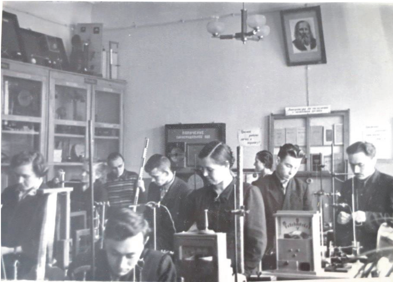
У кабінеті фізики

справи, методики фізики, електротехнічні та фотолабораторії. При кабінеті фізики створено лабораторію шкільного експерименту. Був змінений лаборантський склад кафедри фізики спеціалістами з електротехніки, кіно, фото і радіосправи [66, арк.2].