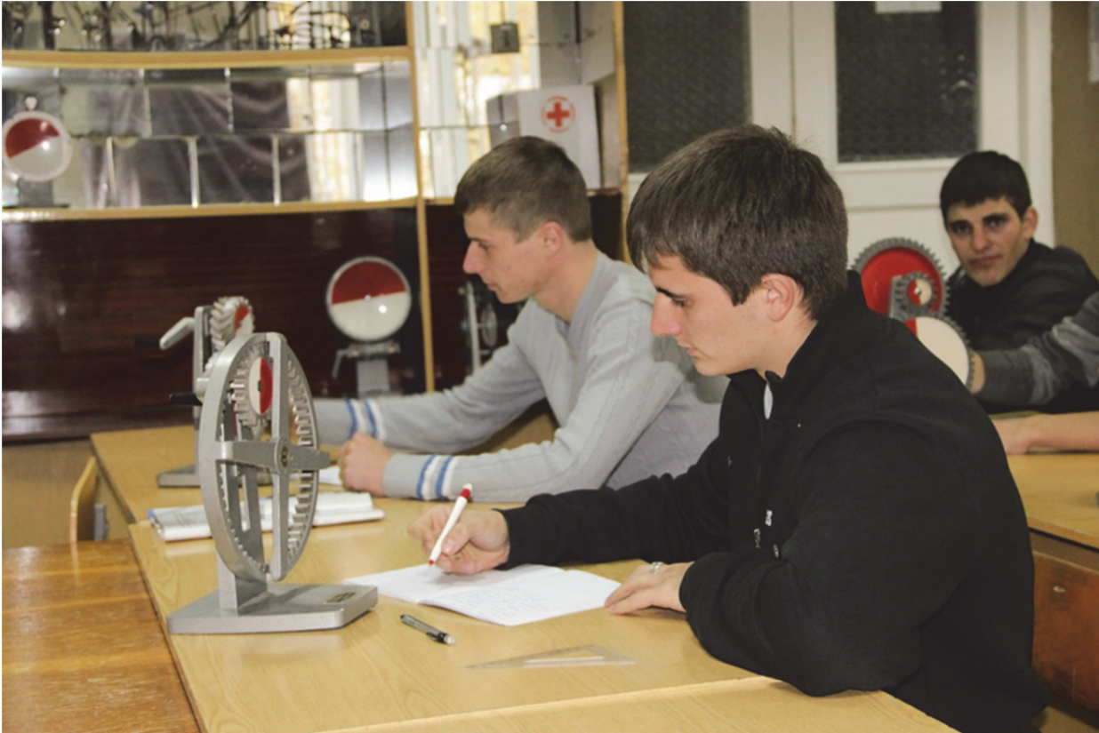
Студенти виконують лабораторну роботу

Головною причиною зниження показників успішності студентів стало те, що з 1992 – 1993 навчального року, крім набору студентів, які навчались за державні кошти, зараховували студентів-контрактників, які навчались за власні кошти, а також за кошти організацій і установ, що направляли їх на навчання. Конкурсний відбір студентів, які навчались за державні кошти, давав можливість відібрати кращих вступників. Хоч був набір і поза конкурсом, яким користувались вступники, що мали пільги (діти-сироти, чорнобильці та інші). Проте студентами-контрактниками зараховували не завжди тих осіб, які мали нахил до педагогічної діяльності та належний рівень знань. Даний контингент студентів певною мірою вплинув на зниження показників успішності. Саме тому з 90-х років у ВНЗ стали визначати окремо успішність цих двох категорій студентів. Так у 1995 – 1996 навчальному році найвищі показники загальної успішності були на факультеті початкового навчання. У студентів-держбюджетників – 98%, а у контрактників – 96%. Але якісні показники у цих двох категорій студентів значно відрізнялись – 40% і 18%. Найбільш контрастні показники успішності були на факультеті