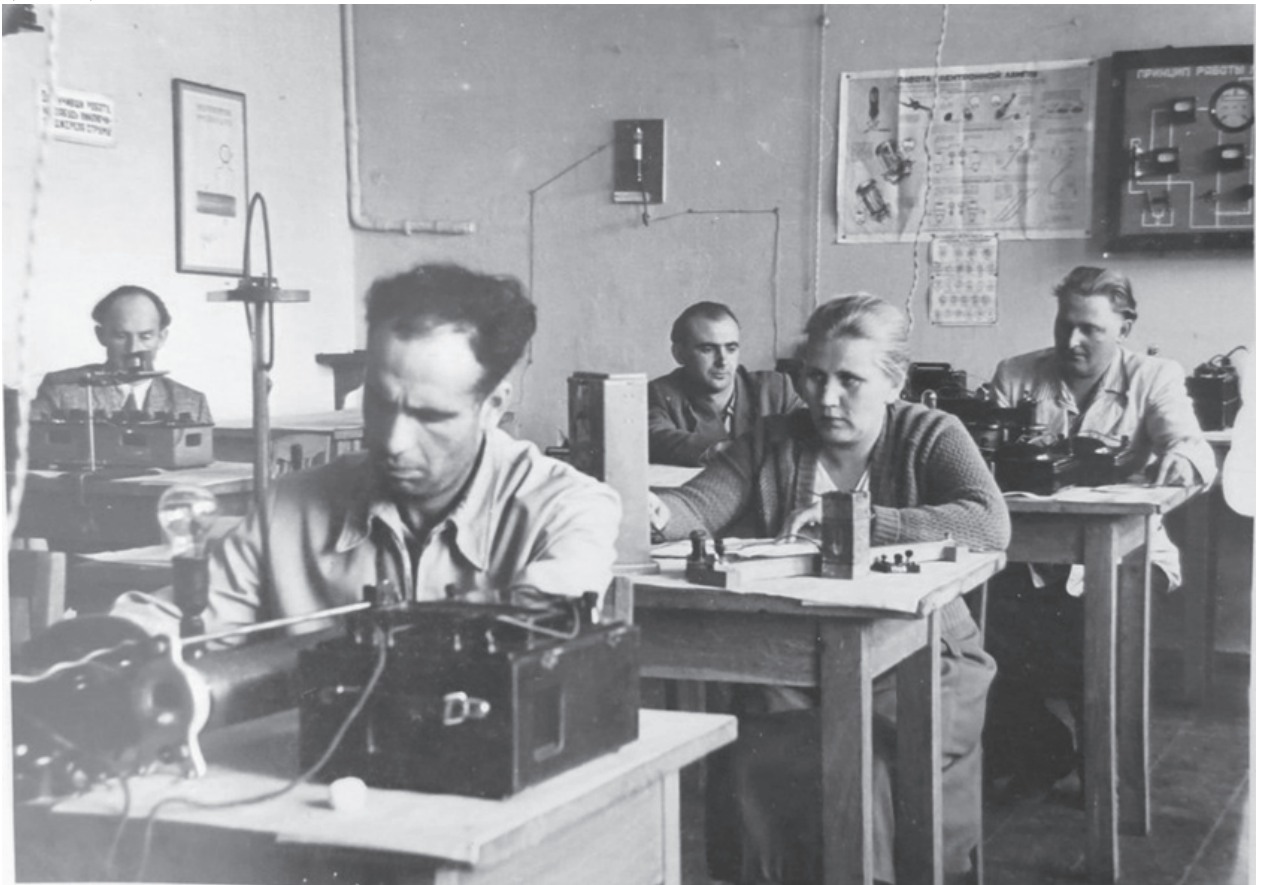
Практичне заняття з фізики

Викладачі фізмат факультету особливу увагу звертали на професійну спрямованість навчальних занять. Добирали такі задачі і вправи, які були пов'язані з основними розділами шкільної навчальної програми. На семінарських та практичних заняттях формували у студентів вміння пояснювати навчальний матеріал стисло, логічно обґрунтовано та аргументовано. Викладачі навчали студентів, яким чином домагатися від учнів чітких, вірно сформованих відповідей, як здійснювати активізацію процесу навчання, як робити записи на дошці та іншого.