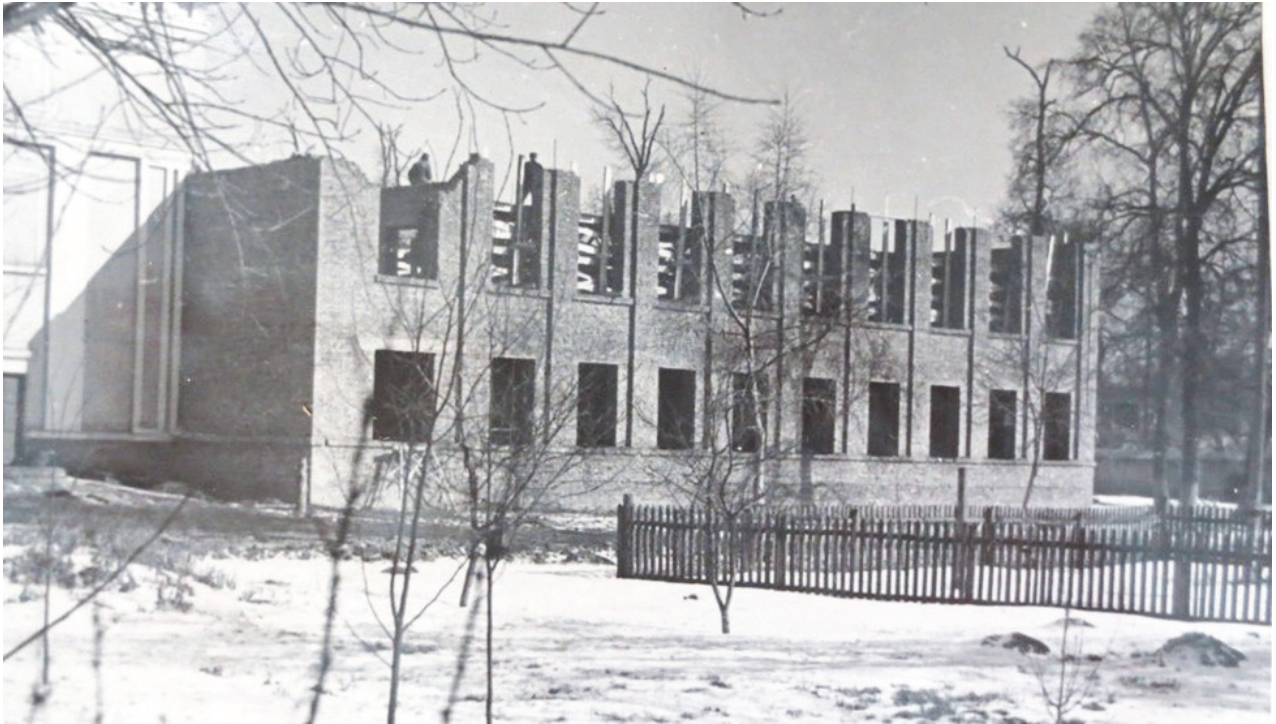
Будівництво навчального корпусу

Значно зросла навчальна база факультету педагогіки і методики початкової освіти. У новозбудованому корпусі розміщено кабінет музики і співів, класи для гри на музичних інструментах, придбано значну їх кількість, що дало змогу забезпечити індивідуальні заняття з музики. На факультеті у 1960 р. налічувалось 9 фортепіано, 37 домбр, 15 скрипок, 24 баяни, 2 комплекти духових інструментів, значна кількість музичної літератури, магнітофонів, радіол та грамплатівок. Обладнано кабінет ручної праці, для якого придбано верстат для обробки дерева, швейні машини, значну кількість різних інструментів.