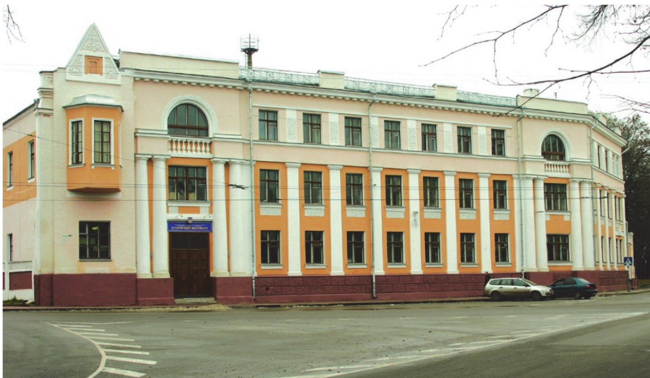
Приміщення історичного факультету

У 1992 р. обласне керівництво передало інституту колишню будівлю обласного управління внутрішніх справ, розташовану в центрі міста. До революції 1917 р. у цьому приміщенні був готель М. Бодаєва, у тридцяті роки – НКВС, у повоєнні роки – знаходилось управління внутрішніх справ. Приміщення вмістило близько 800 студентів історичного факультету денного відділення і понад 50 викладачів. Хоч заняття в цьому приміщенні проходили теж у дві зміни[97, с. 11].