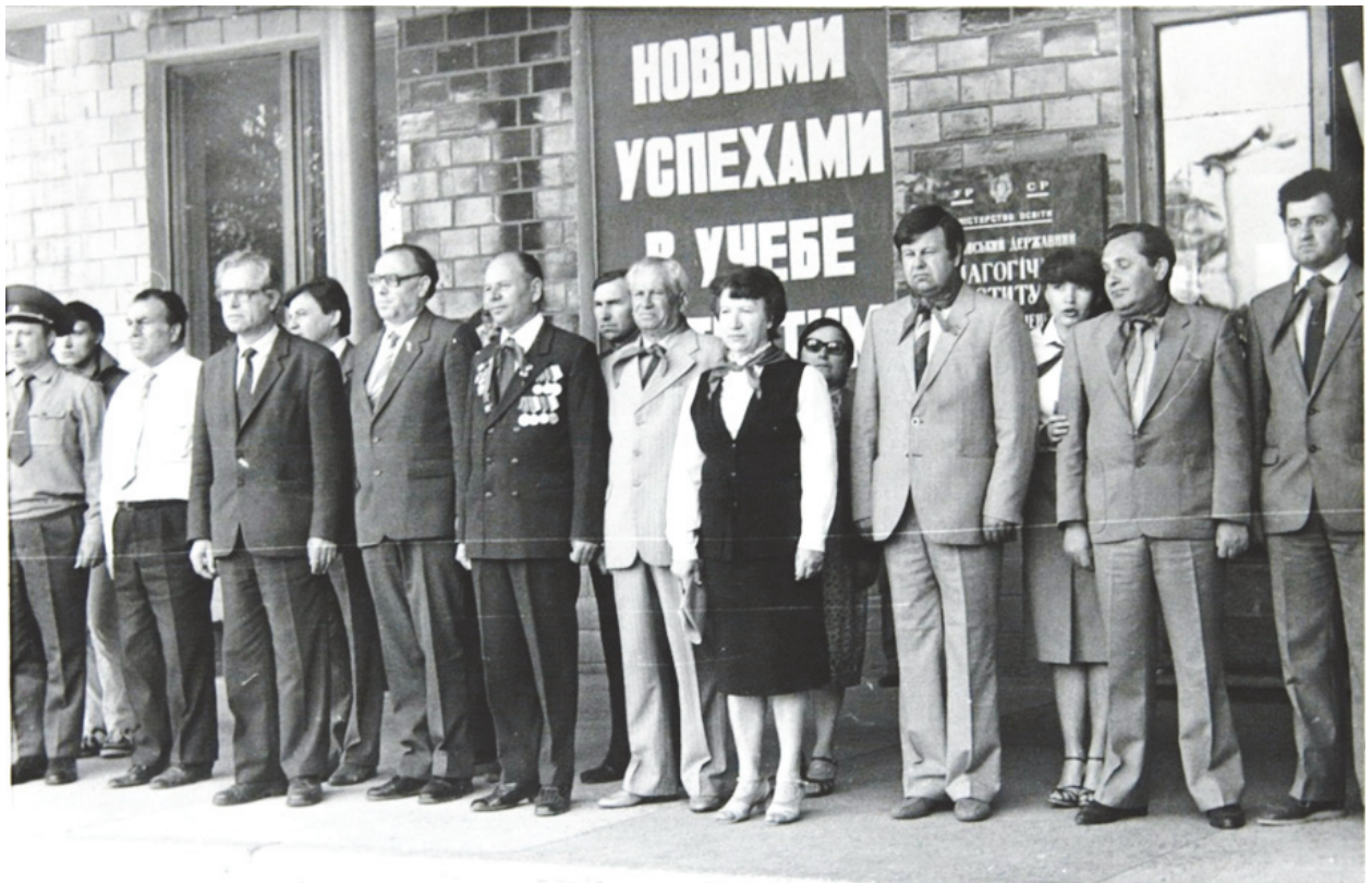
Настановча конференція перед початком піонерської практики

них тижні або ж по 6 годин кожного тижня і була включена до графіка навчального процесу. У 5 і 6 семестрах завдання практики були пов'язані з вивченням методики навчання історії та формуванням умінь спостерігати, планувати і проводити виховні заходи та перші пробні уроки, а у 7 і 8 семестрах – завдання пов'язані з вивченням курсу основ педагогічної майстерності та формуванням умінь підготовки і проведення пробних уроків та їх аналізу.