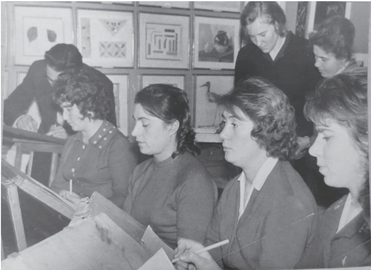
Практичне заняття з малювання

льних років в інституті працювали всього два факультети – фізико-математичний та мовно-літературний. Останній працював до 1957 р., а потім після його закриття розпочав роботу факультет підготовки учителів початкових класів. За цей час відбулось значне зростання кількості штатних викладачів від 33 до 98 осіб. Також покращився якісний стан викладацького складу. Якщо у 1954 р. всього 6 викладачів мали кандидатські ступені, то вже у 1965 р. – була 21 особа. Зросла кількість кафедр з 6 до 11, які могли повною мірою забезпечували навчально-виховний процес.