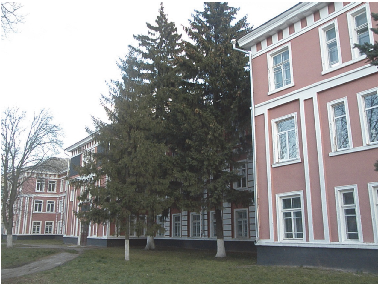
Приміщення педагогічного інституту