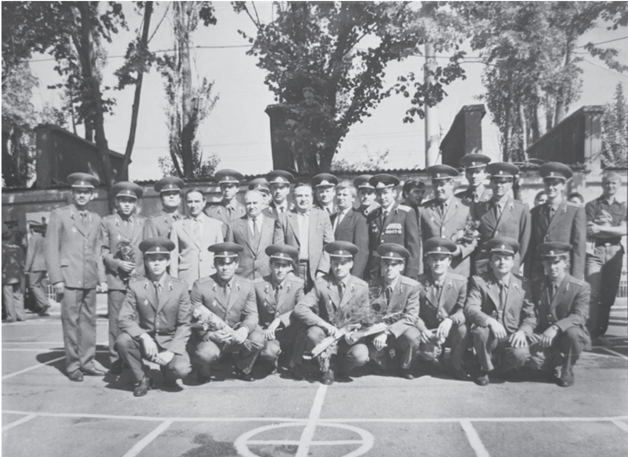
Викладачі військової кафедри разом із своїми вихованцями

На чотирьох факультетах йшла підготовка педагогічних кадрів на заочному відділенні. 375 осіб набували спеціальність учителя історії та суспільствознавства, 335 – учителя фізвиховання, 790 – учителя початкових класів, 348 – учителя трудового навчання. Із 1848 студентів-заочників 609 (32,9%) – були учителями в сільських школах, 84 (4,5%) – вихователями груп продовженого дня, 242 (13,1%) – піонервожатими. Заочне відділення давало можливість 572 випускникам педучилищ, а це складало 30,9% від загальної кількості студентів-заочників, продовжити навчання у ВНЗ і набути вищу освіту [220, арк. 65]. Загальний контингент студентів на 1990 – 1991 початковий рік становив 5379 осіб. Це була найбільша чисельність студентів за час діяльності Чернігівського педагогічного інституту.