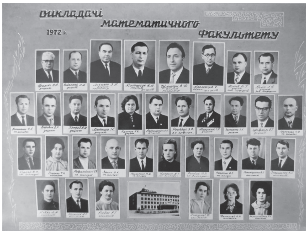
Викладачі математичного факультету

Зміни в структурі факультетів відбулись у грудні 1969 р. Вони були пов'язані з поділом одного з найбільших факультетів інституту – фізико-математичного. Ще 15 жовтня Міністерством освіти УРСР був даний дозвіл на його поділ. 8 грудня він був поділений на математичний і фізичний факультети. До математичного факультету були віднесені спеціальності: «математика» та «математика і фізика». Кафедрами цього факультету були кафедра вищої математики та кафедра елементарної математики і методики математики.