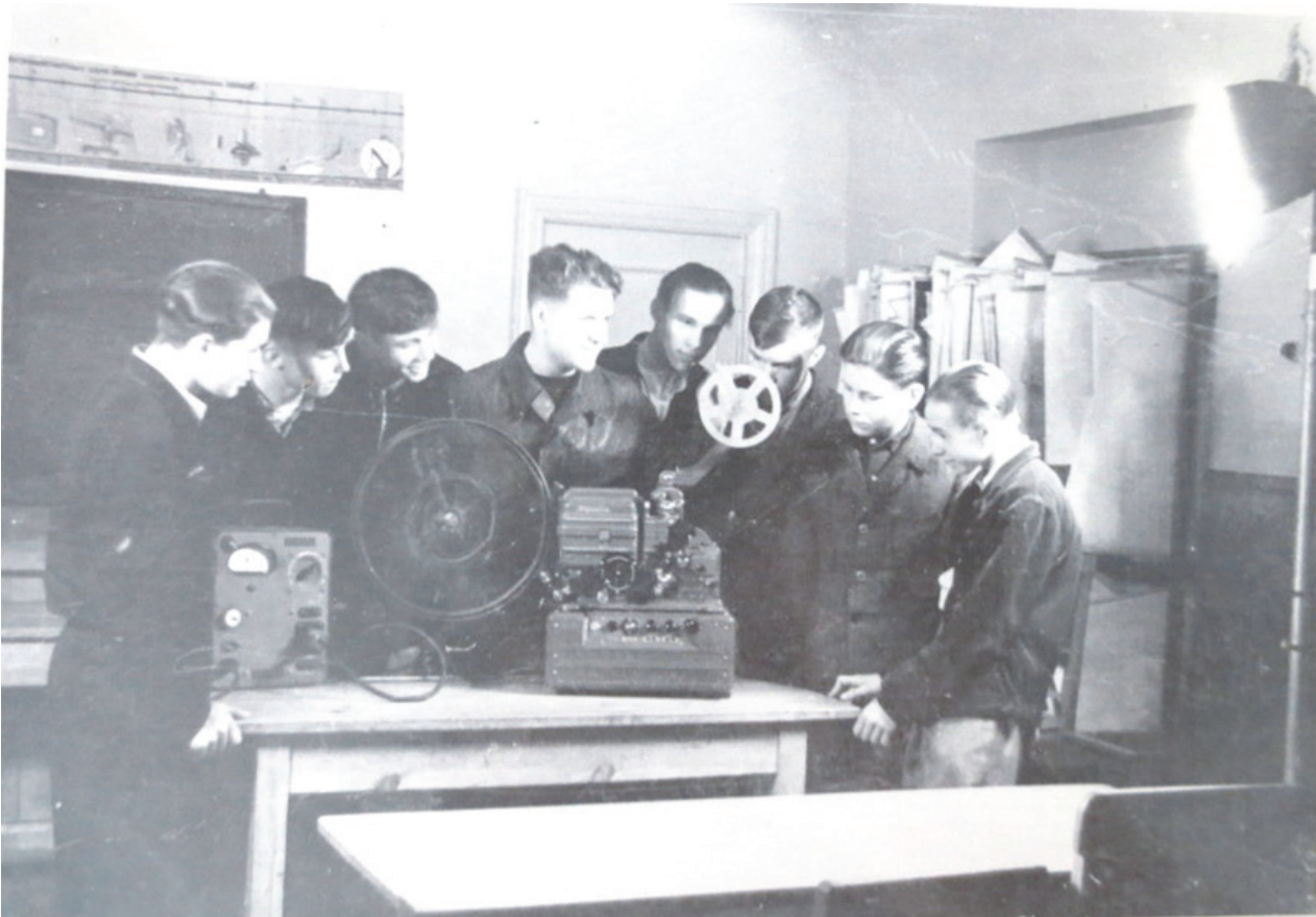
Студенти вивчають кінопроектор

фільмофондів інституту використовувалось 255 фільмокопій та значна кількість навчальних фільмів міської фільмотеки. У розпорядженні викладачів було 126 діапроекторів, 19 телевізорів, 11 відеомагнітофонів[94, арк. 8].