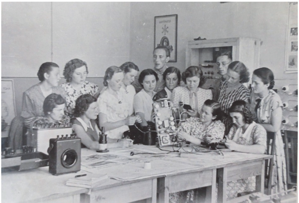
Заняття гуртка радіотехніки

З метою покращення політехнічної підготовки кожен із студентів, що навчався на факультеті, за час навчання отримував посвідчення кінодемонстратора, права на управління трактора і автомобіля, певний розряд із токарної чи слюсарної справи. Крім того, всі студенти набували умінь та навичок з фотосправи та електро- і радіотехніки. Переважна більшість студентів старших курсів фізмату керували в школах міста різними технічними та математичними гуртками, працювали на станції юних техніків [239, арк. 61].