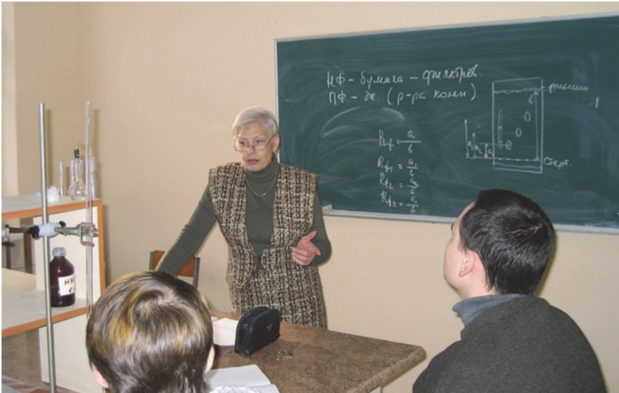
На заняттях з хімії