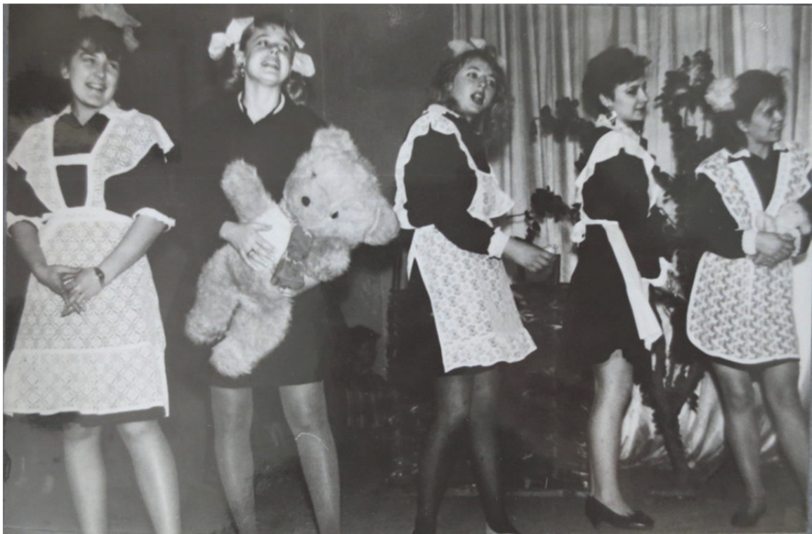
Змагання команд КВК

Загальні результати були непоганими, але аналіз виконаних робіт з окремих навчальних дисциплін та в окремих групах показав значні розбіжності в результатах оцінки знань студентів, виявлених на екзаменах під час останньої сесії та у контрольних роботах. Так, з математики у 31 групі спеціальності «початкове навчання» різниця становила 37,7%, з хімії у 32 групі спеціальності «хімія» – 21,2%, з інформатики та обчислювальної техніки у 54 групі спеціальності «математика» – 36,4%. Значні розбіжності у порівнянні з екзаменаційними оцінками виявлені з педагогіки у 44 групі спеціальності «фізичне виховання», де різниця в показниках успішності становила 36,4%, з психології у 35 групі спеціальності «початкове навчання» – 46%, з соціальної психології на спеціальності «історія і психологія» – 34%.