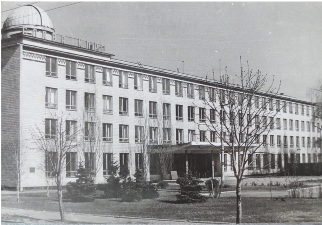
Новий навчальний корпус

Саме на початку 1969-1970 н.р. було введено в експлуатацію добудову до існуючого навчального приміщення нового навчального корпусу, загальною площею 7740 м 2 . В ньому були розміщені фізичний і математичний факультети, аудиторії, бібліотека, читальні зали, їдальня, кабінет суспільних дисциплін, лабораторії, адміністрація інституту. У той же час інститут замовив виготовлення проектної документації на будівництво спортивного комплексу для факультету фізвиховання [81, арк. 5].