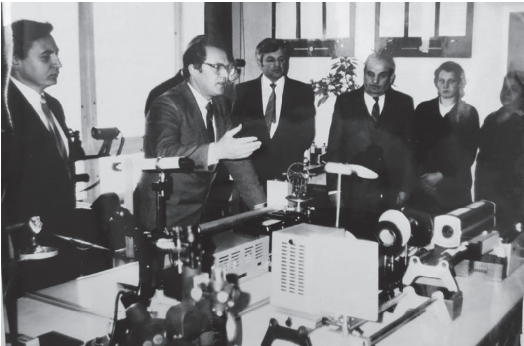
У лабораторії рідких кристалів

Кількість наукових тем, які розроблялись в педінституті у 80-ті роки, була в межах 100 – 120. Так, у 1985 р. їх кількість становила 98 тем, 4 з яких були включені до всесоюзних, 7 – до республіканських і 12 – до відомчих планів науково-дослідної роботи. Госпдоговірні теми виконувались викладачами і співробітниками 5 кафедр: 9 кандидатів наук та 14 осіб навчально-допоміжного персоналу. Договорів з підприємствами підписано на суму 113 тисяч карбованців. У звітах про наукову роботу особливо відзначається робота кафедри фізики на чолі з доц. М.І. Гриценком. Викладачі і співробітники виконували госпдоговірні роботи з підприємствами міст Харкова та Києва, обладнали в підвальному приміщенні лабораторію рідких кристалів, яка, за словами завідувача відділом Інституту кристалографії АН СРСР професора Л.М. Блінова, за обладнанням та корисністю і цінністю досліджень була на рівні кращих лабораторій СРСР [358, арк. 18].