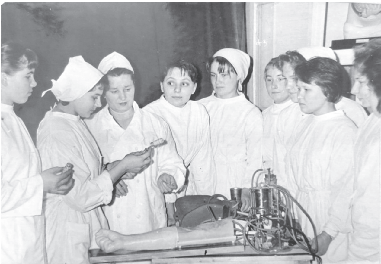
Практичне заняття з медичної підготовки

Ще одна зміна у структурі кафедр факультету фізвиховання відбулась у вересні 1981 р. Від кафедри теорії і методики фізичного виховання було відокремлено кафедру легкої атлетики. Наказом ректора № 251-вк від 10 вересня 1981 р. був визначений персональний склад обох кафедр. До кафедри легкої атлетики увійшли 13 викладачів і 1 лаборант. Очолив кафедру старший викладач М.І. Шмаргун. Кафедра теорії і методики фізичного виховання налічувала 10 викладачів та 2 лаборантів. Завідувачем кафедри став М.М. Огієнко [151, арк. 91-92].