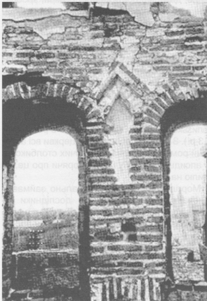
Рис. 4. Ніша між вікнами північного фасаду (за М. В. Холостенком).

У 1945 р. було проведено другий цикл робіт по укріпленню руїн П'ятницького храму. З 15 жовтня по 15 грудня був закріплений північно-східний пілон, знято цегляні над-