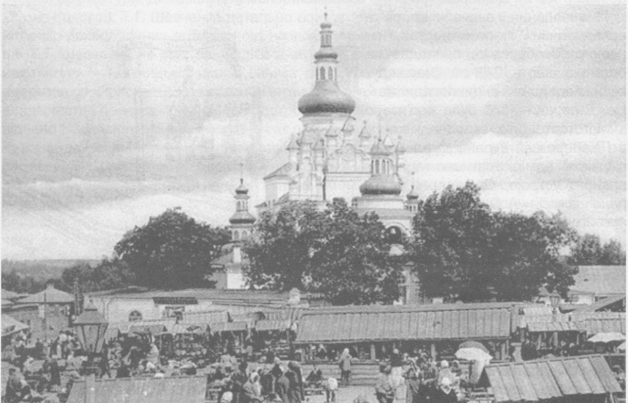
Рис. 1. П'ятницька церква на Червоній площі (інакше – на Старому базарі, або ж на П'ятницькому полі)

Собор монастиря, більше відомий під назвою П'ятницької церкви на Червоній площі (інакше – на Старому базарі, або ж на П'ятницькому полі), належить до числа тих пам'яток давньоруської архітектури, які внаслідок пізніших перебудов настільки змінили свій вигляд, що під новою зовнішністю майже неможливо розгледіти їх справжні риси, що визначають характерні особливості епохи і стилю (Рис. 1).