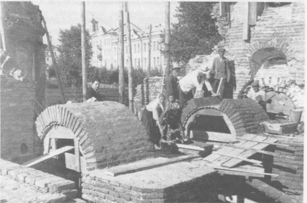
Рис. 6. Під час реставраційних робіт