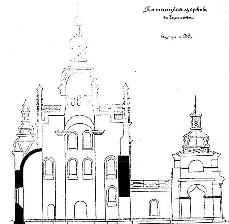
Рис. 3. План П'ятницької церкви, виконаний П.О. Лашкар'євим.

Датування П'ятницького храму вченими за відсутністю літописних даних встановлювалося досить порізно. Причому більш ранні історики, кінця XVIII-першої половини XIX ст., розглядали його, навіть, як будівлю, повністю побудовану в першій половині або в кінці XVII ст. Деякий інший погляд на пам'ятник встановився в науковій літературі і зберігся на довгий час після того, як професор Київської духовної академії П.О. Лашкар'єв за результатами обстеження у 1895 р. пам'яток архітектури Чернігова заявив у доповіді на XI Археологіч-