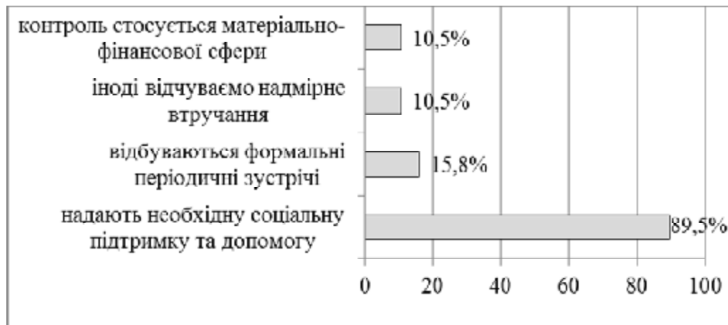
Рис. 2. Участь соціальних служб у функціонуванні прийомних сімей, ДБСТ

Загалом участь соціальних служб у житті прийомних сімей та ДБСТ характеризується батьками позитивно (надають необхідну соціальну допомогу і підтримку), проте насторожують відповіді щодо формальної взаємодії або ж надмірного втручання з боку державних служб. Результати аналізу відповідей на це питання представлені на рис. 2. (Сума відсотків перевищує 100, оскільки респонденти назвали 2-3 варіанти).