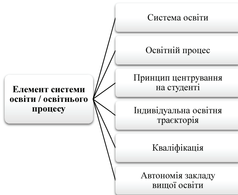
Рис. 2. Елемент системи освіти / освітнього процесу (Кульчицька, 2014; Безбородько, 2023)

учасниками освітнього процесу. Також до системи входять органи управління в галузі освіти та нормативні документи, що регулюють їхні взаємини. На рівні окремого освітнього закладу реалізація освітньої програми передбачає унікальну педагогічну взаємодію між учасниками процесу, де застосовуються усі доступні ресурси на основі чинних стандартів.