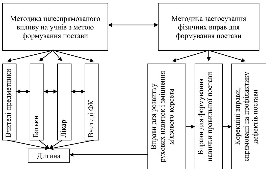
Рис. 2. Системний підхід до організації процесу формування постави у дітей молодшого шкільного віку

– формування мотиваційної сфери в процесі свідомого ставлення до власної рухової діяльності та свідомого ставлення до формування правильної постави; – прийняття учнями молодших класів відповідальності за свою підготовку, самоаналіз, саморозвиток; – діяльнісного формування культури здоров'я.