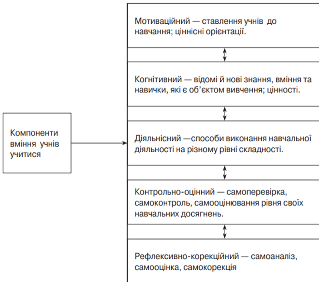
Рис. 1.1. Компоненти вміння учнів учитися [40]

Варто підкреслити важливість мотиваційного компонента в освітньому процесі і його роль у формуванні учнівської самостійності. Основною метою мотиваційного компонента є стимулювання стійкого позитивного ставлення до навчання, формування допитливості і закріплення особистісного сенсу навчальних дій. Це включає створення умов для розвитку внутрішньої потреби до самостійного учіння. Потреба є основою для формування мотиву, який, в свою чергу, спонукає до конкретної діяльності. У освітньому процесі це проявляється у формуванні мотивів учіння, що безпосередньо вплине на успішність навчання [40].