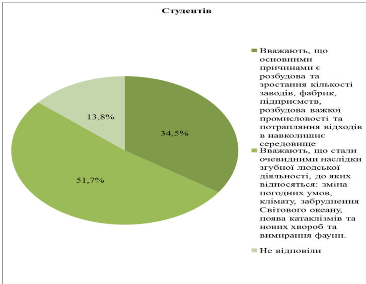
Рис. 1. Причини стрімкого зростання інтересу людства до вирішення екологічних проблем